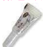
レボリューション