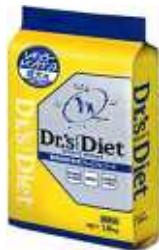
成犬用(1~7歳まで) レギュラーメンテナンス