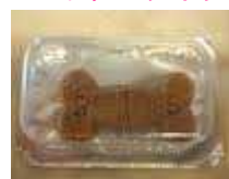
イベルメックチュアブル