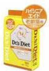
老齢猫用(11歳以上) ハイシニアエイド

前シリーズの時にシニアライトを ダイエット目的で食べていた子の 場合は、エイジングエイドの方が カロリーが低いためお勧めです