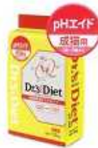
成猫用(1~6歳まで) pHエイド