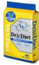
高齢犬用(8歳以上) エイジングエイド