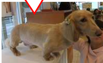
(3mm カット ¥5250)